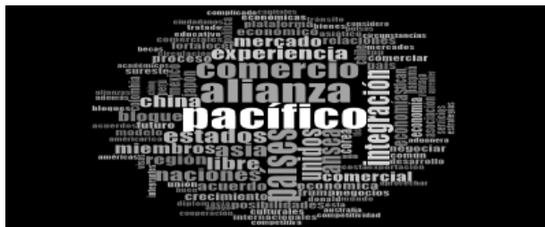
Imagen 2. Nube de palabras de la variable Plataforma Comercial

En la 2ª nube, y al igual que en las otras nubes Alianza del Pacífico esta al centro y tal como ya se ha mencionado, la Alianza tiene 3 objetivos y el tercero se refiere a ser una plataforma de libre comercio con el mundo haciendo énfasis en Asia Pacífico, razón por la cual aparece plataforma en un tercer plano, no obstante, lo ya mencionado por los especialistas nos muestra un gráfico con muchas palabras todas importantes y que hacen sentido a lo ya comentado por los especialistas.